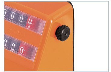
Molette pour positionner Ruedita para colocar