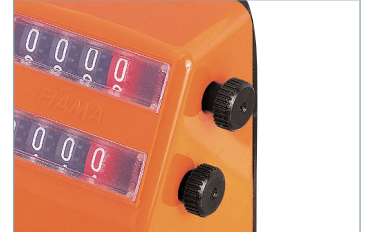
Double molette pour positionner Doble ruedita para colocar