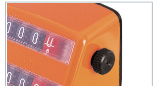
Molette pour positionner Ruedita para colocar