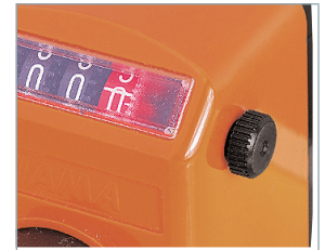
Rotella di posizionamento Positioning push button